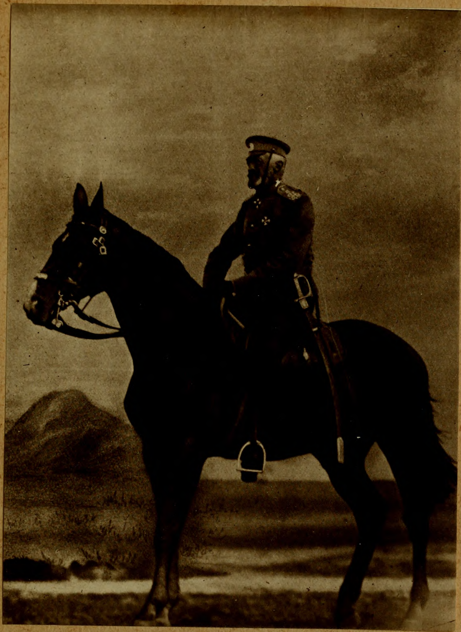
Его Высочество Великій Князь НИКОЛАЙ НИКОЛАЕВИЧЪ назначенный Главнoкомандующимъ Кавказскимъ фронтомъ.